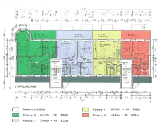
Grundriss Wohnung Nr. 09